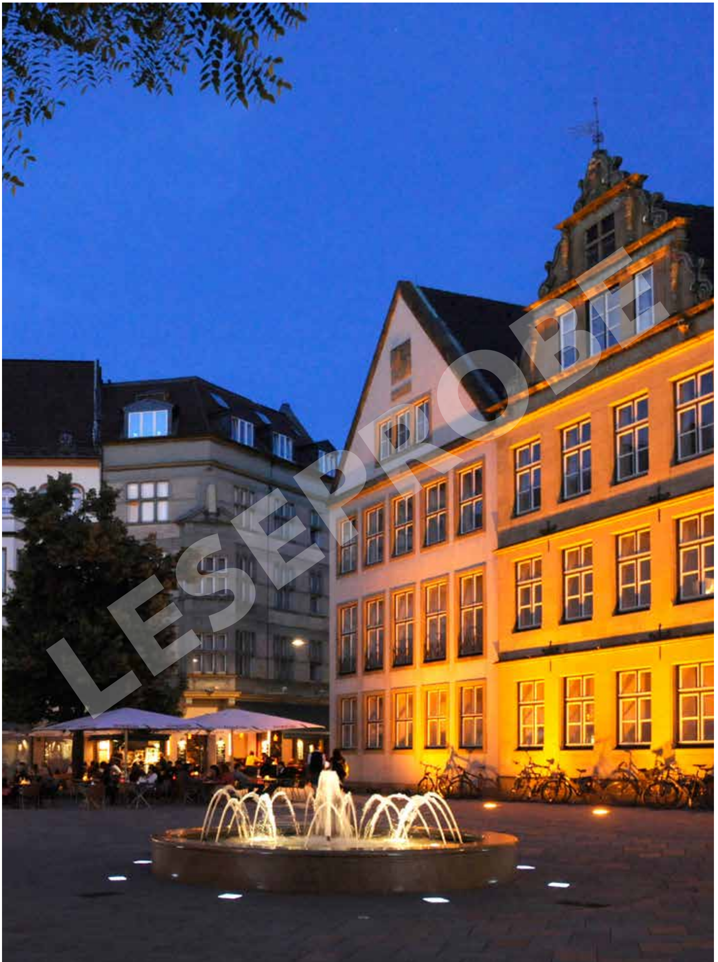
Blick auf den Alten Markt in der Bielefelder Altstadt