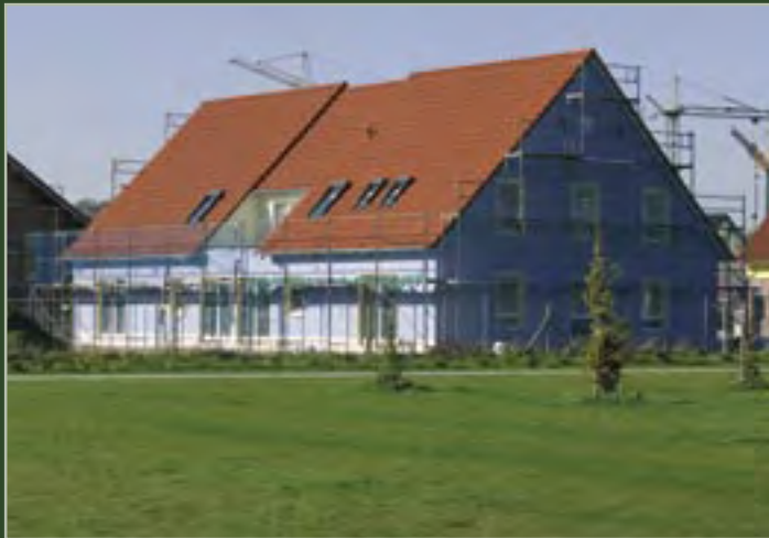
KiTa, Hof Hallau