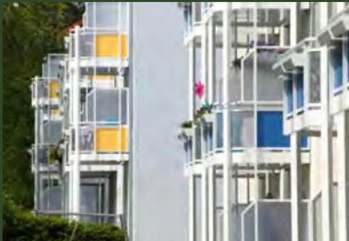
Modernisierung „Am Alten Dreisch“